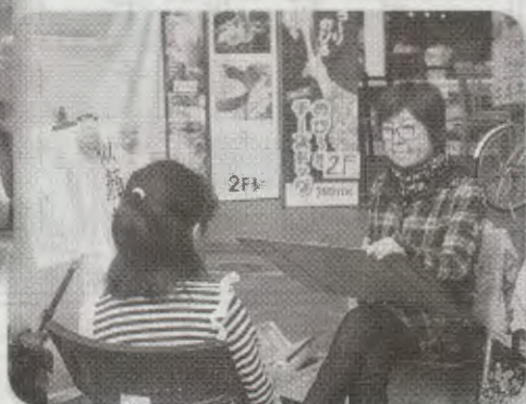
似顔絵お互い緊張です！