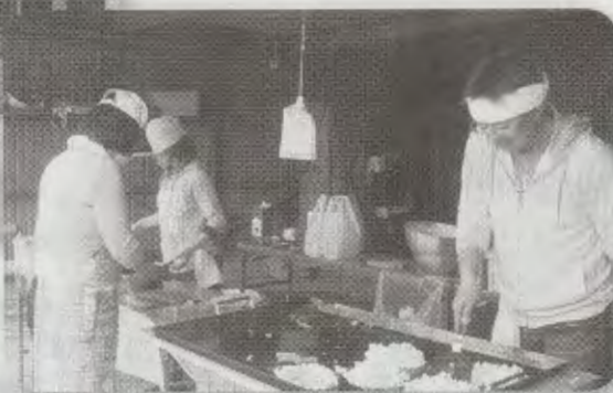
お好み焼きも頑張ってます